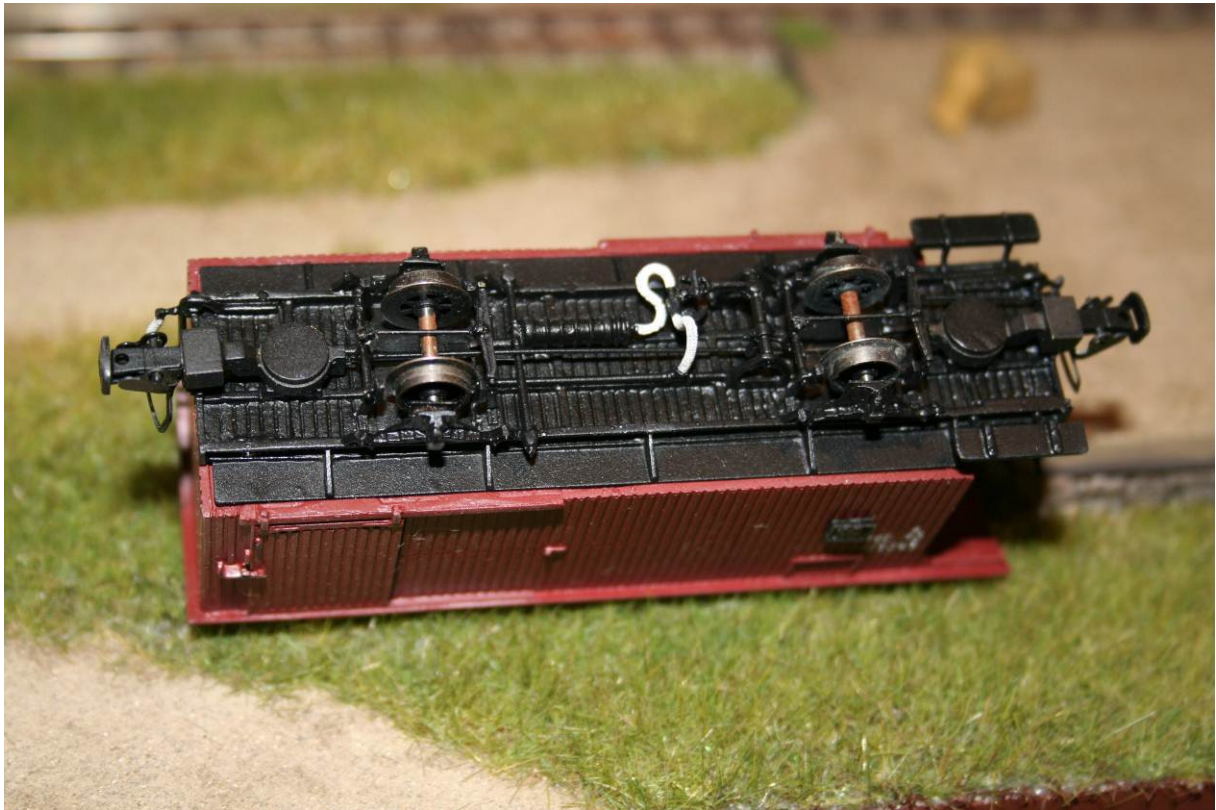
Foto oben: Das detailliert nachgebildete Untergestell des Modells 1308S mit komplett nachgebildeter Bremsanlage!

Das untere Foto zeigt das Untergestell des Modells 1308 , wie die Wagen im Original nur mit Bremsleitung und Handspindelbremse im Einsatz standen!